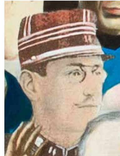
© Ram Katzir, Sgt. Kasher Jewish Hearts Club Band, 2006. Collection Jewish Historical Museum, Amsterdam.