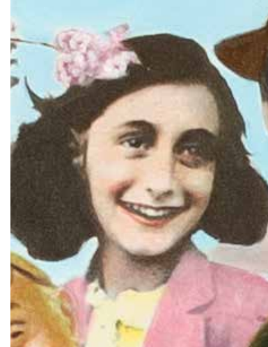
© Ram Katzir, Sgt. Kosher Jewish Hearts Club Band, 2006. Collection Jewish Historical Museum, Amsterdam.