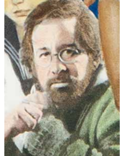
© Ram Katzir, Sgt. Koster Jewish Hearts Club Band, 2006. Collection Jewish Historical Museum, Amsterdam.