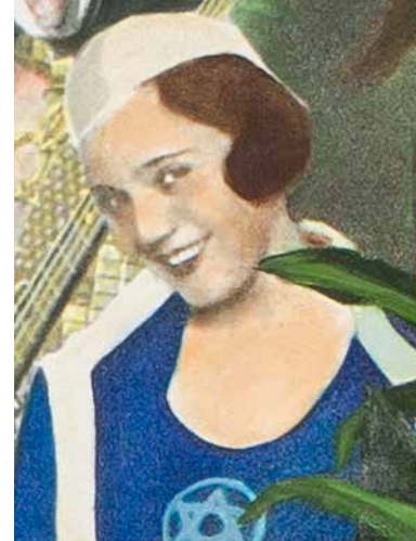
© Ram Katzir, Sgt. Kosher Jewish Hearts Club Band, 2006. Collection Jewish Historical Museum, Amsterdam.